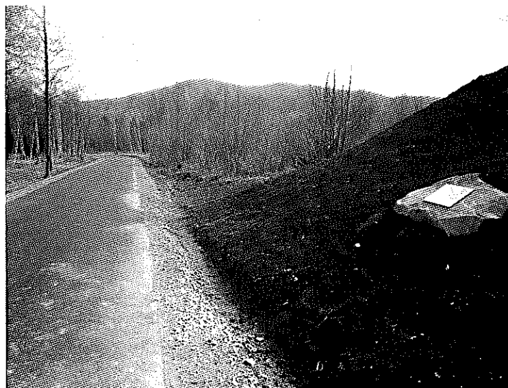
panetni stezka 2.JPG