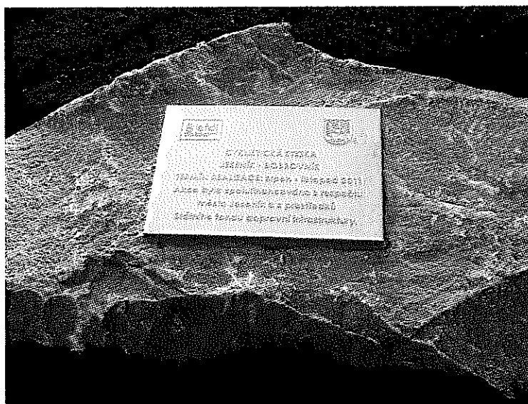
panetni stezka 1.JPG