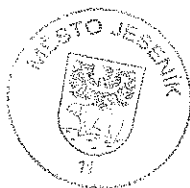
Město Jeseník Poskytovatel