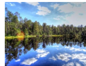
Zlatorudné mlýny - C